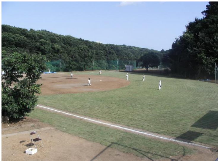
↑天然芝を張った3号グラウンドは美しい