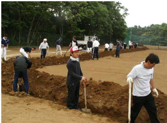
↓青い空、緑の森、土の香り